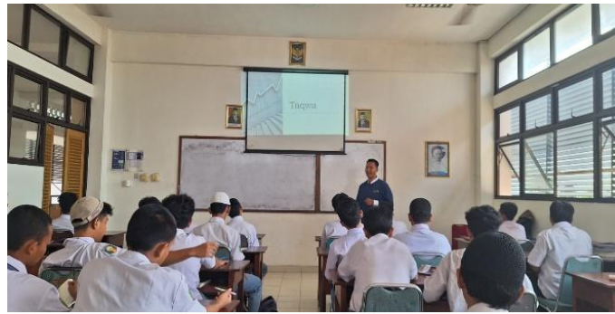
Gambar 1. Proses pembelajaran siklus 1.

berlangsung 75 menit. Kegiatan terakhir adalah kegiatan penutup terdiri dari guru mengelaborasi dengan pertanyaan pelacak berkaitan dengan materi yang sudah dibahas, menyampaikan materi yang akan dipelajari pada pertemuan berikutnya dan mengakhiri dengan salam dengan durasi waktu 5 menit.