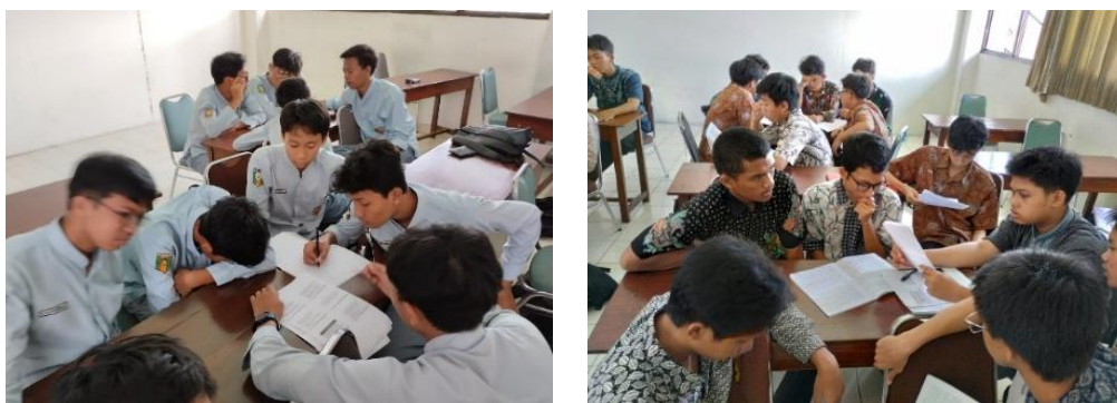
Gambar 3. Diskusi kelompok.

Pada kegiatan inti guru membagi kelas menjadi 4 kelompok, setiap kelompok terdiri dari 8 orang. Pengelompokan ini diatur sedemikian rupa dengan memperhatikan gaya belajar pada anak. Setelah menentukan kelompok, masing masing anak bergabung sesuai kelompoknya. Kegiatan pembelajaran dilanjutkan dengan mengamati video berkaitan dengan perilaku tercela. Selanjutnya guru memandu anggota kelompok untuk mengomentari video tersebut dan dilanjutkan dengan mencari informasi tambahan terkait konsep sifat tercela serta kontekstualisasi materi dalam kehidupan sehari-hari. Setelah diskusi selesai, kelompok mempresentasikan hasil diskusinya di depan kelas. Terlihat ada beberapa kelompok yang sangat menonjol dalam presentasi dengan penyampaian yang sangat baik. Setelah satu kelompok selesai melakukan presentasi, kemudian kelompok lain memberikan pendapat, komentar dan pertanyaan. Tampak terjadi hubungan timbal balik yang luar biasa dalam kelas. Kegiatan tersebut berlangsung cukup lama kurang lebih 70 menit. Dan masih menyisakan dua kelompok yang belum presentasi.