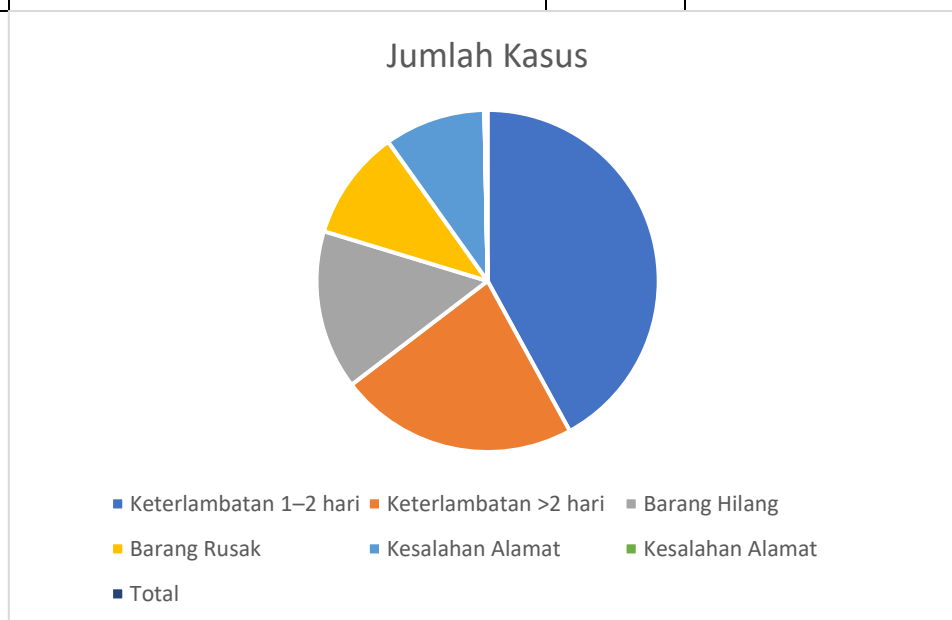
Gambar 1. Proporsi Faktor Penyebab Keterlambatan Pengiriman