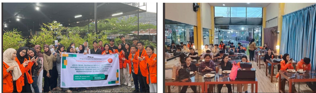
Gambar 2. Kegiatan Pengabdian Masyarakat

Dengan demikian, kegiatan ini dapat dipandang sebagai langkah awal menuju model edukasi kewirausahaan berbasis literasi hukum yang lebih komprehensif. Ke depan, perlu dilakukan replikasi dan pengembangan program serupa di berbagai sekolah dan perguruan tinggi, dengan melibatkan pemerintah daerah, praktisi bisnis, dan lembaga sertifikasi agar peserta memperoleh pengalaman belajar yang lebih luas dan mendalam. Melalui upaya ini, diharapkan generasi muda tidak hanya siap menghadapi tantangan bisnis modern, tetapi juga mampu berkontribusi terhadap pembangunan ekonomi daerah secara legal, beretika, dan berkelanjutan.