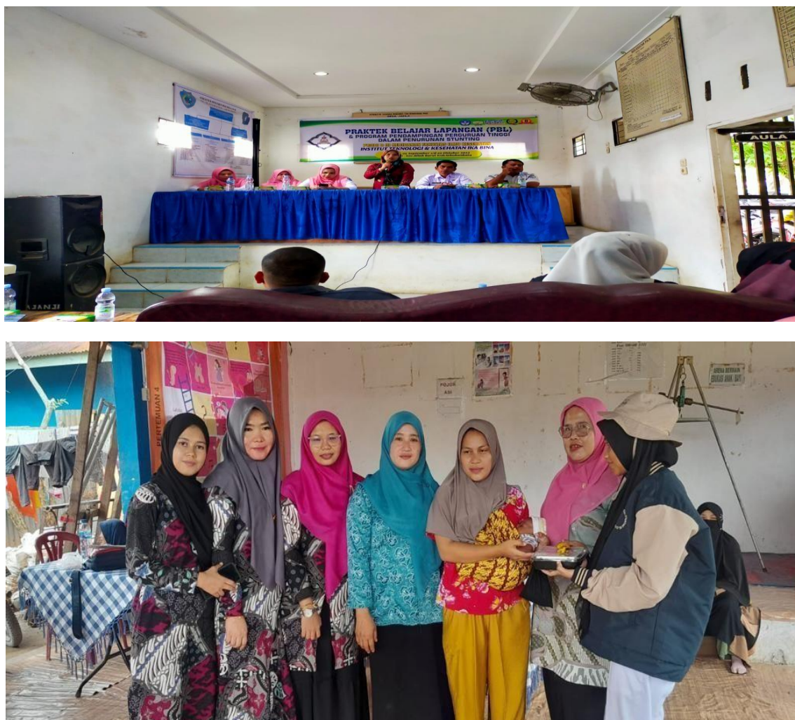
Gambar 1. Pembukaan dan Pertemuan dengan Pihak Desa Janji

Harapannya dalam penyuluhan ini adalah agar masyarakat desa Janju terlebih para orang tua bisa menyadari betapa pentingnya kesehatan bayi atau anak mereka, meningkatkan peran sertanya terhadap pertumbuhan dan pencegahan stunting bayi dan balita dengan cara ikut pemantauan terhadap pertumbuhan dan perkembangan putra putrinya, karena memang mayoritas masyarakat Desa Janji.