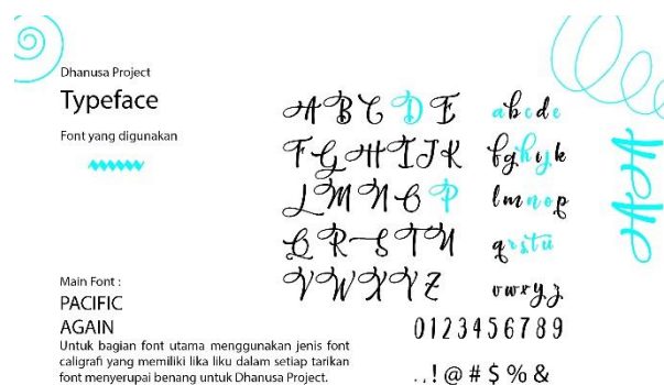
Gambar 8. Font Pacific Again

Pada perancangan Logo Dhanusa Project ini, Penulis menggunakan 1 jenis font dengan nama “Pacific Again”.