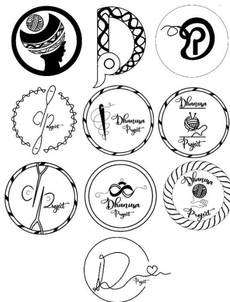
Gambar 5. Alternatif Sketsa Logo