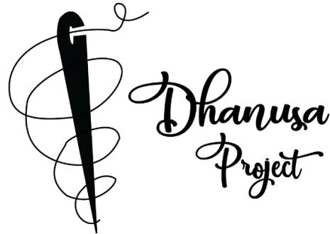
Gambar 6. Alternatif Sketsa Logo

Digitalisasi logo untuk branding identitas visual UMKM Dhanusa Project. Logo ini terpilih karena dinilai yang paling mempresentasikan identitas dari UMKM Dhanusa Project yang ada pada pesan yang ingin disampaikan melalui visual dari logo tersebut, antara logotype dan logogram. Kemudian sketsa logo tersebut penulis transfer melalui bentuk digitalisasi dan pemberian warna yang sesuai dengan keadaan UMKM Dhanusa Project tersebut.