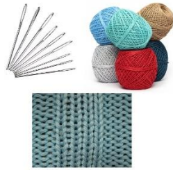
Gambar 4. Mood Board