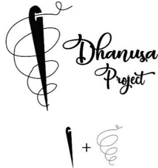
Gambar 9. Makna Logo

Bentuk logo diambil dari alat dan bahan yang digunakan pengkarya dalam membuat suatu karya, yaitu jarum dan benang sebagai perwakilan dari bahan dan alat yang digunakan. Hal ini diartikan sebagai Dhanusa Project adalah sebuah komunitas yang memiliki karya handmade yang memiliki bahan dasar benang. Bentuk dari logo seperti benang yang mengelilingi jarum diartikan ibarat putaran benang dari bawah yang kecil semakin lama semakin besar sampai dititik putaran besar, melambangkan dari orang kalangan bawah yang memiliki sebuah karya dan ingin menyampaikan karya tersebut sampai ke Nusantara.