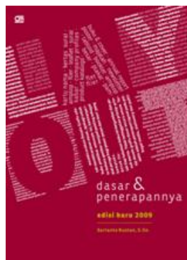
Gambar 3. E- Book Layout dasar & penerapannya

Berdasarkan kutipan dari e - book yang telah dijelaskan, penulis menjadikan buku ini sebagai acuan dalam pembuatan layout dalam desain grafis ini menjadikan referensi untuk penulisan pembuatan jarak antara huruf/karakter, jarak antar kata, dan jarak antar baris pada pembuatan font yang akan dibuat nanti. Dan menjadi acuan penulis dalam mendesain poster penjelasan singkat tentang ornamen tampuk manggis sebagai media visual.