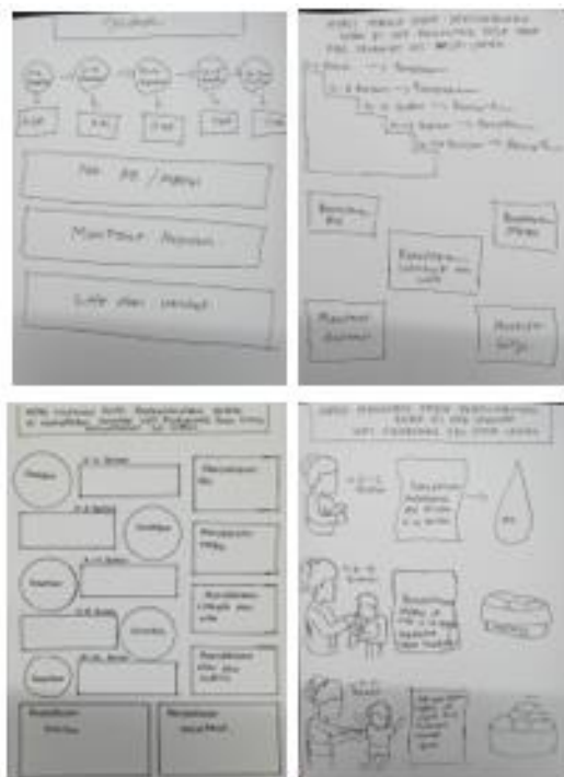
Gambar 7. Alternatif Sketsa infografis

Berikut adalah beberapa alternatif sketsa infografis untuk media karya cetak ilustrasi di UPT. Puskesmas