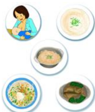
Gambar 5. Moodboard

Moodboard disusun sebagai referensi untuk mendapatkan gambaran visual dari desain yang akan dibuat.