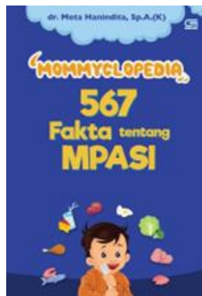
Gambar 1. E- Book 'MOMMYCLOPEDIA' 567 Fakta Tentang MPASI

Berdasarkan kutipan dari e - book yang telah dijelaskan, penulis menjadikan e - book ini sebagai menjadi bahan referensi untuk penulis yang akan digunakan sebagai cara untuk mengetahui serta menguasai tentang MPASI sebagai membuat informasi perancangan infografis mpasi pada pertumbuhan anak sebagai edukasi masyarakat.