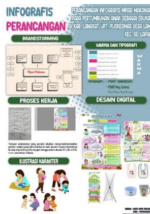
Gambar 21. Poster Perancangan

Berikut ini Merupakan poster proses perancangan Infografis Mpasi Pada Pertumbuhan Anak Sebagai Edukasi Terhadap Masyarakat di Kabupaten Langkat UPT. Puskesmas Desa Lama Kec. Sei Lapan