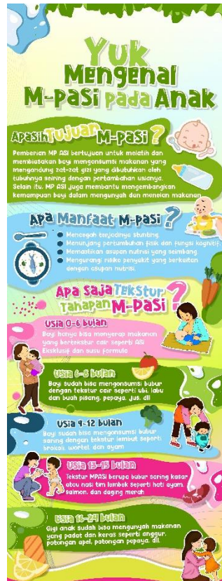
Gambar 13. X- Banner dan Brosur