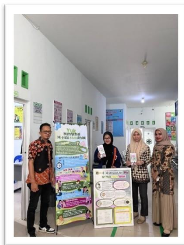
Gambar 9. Dokumentasi Audi

Dalam perancang infografis, pengkarya menggunakan Software Adobe Photoshop proses layout dan Clip Studio untuk ilustrasi digital. Infografis dirancang dengan ukuran A0 (84,1 cm x 118,9 cm).