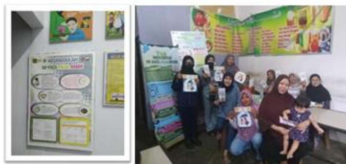
Gambar 12. Dokumentasi Audi

Berikut merupakan implemetasi dari media imfografis beserta juga dengan media pendukung lainnya yang dapat digunakan untuk menginformasikan tentang adanya MPASI sebagai edukasi masyarakat terutama terhadap kepada ibu yang diselenggarakan dikawasan kec. Langkat kota Brandan.