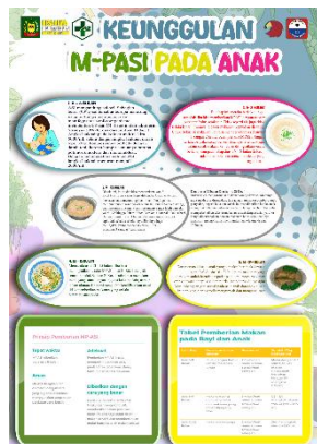
Gambar 8. Digital infografis Mpasi