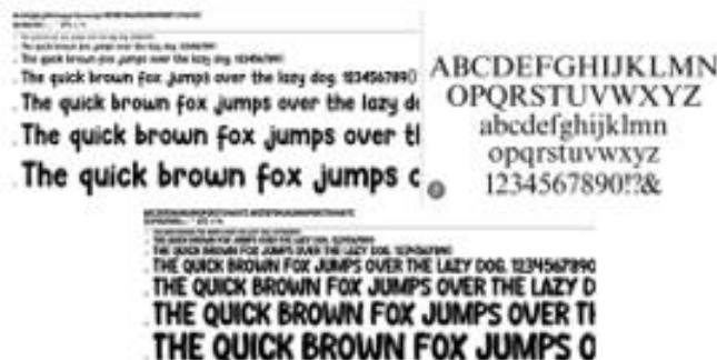
Gambar 11. Typography

Font yang dipilih jenis font “Serif”, dan jenis font “Sans serif” . Pemilihan jenis font tersebut berdasarkan pertimbangan bahwa huruf serif memiliki ketebalan dan ketipisan yang kontras pada garis-garis hurufnya. Kesan yang ditimbulkan adalah klasik, dan elegan. Berdasarkan pertimbangan tersebut, untuk membantu penekanan classic dan elegant, font jenis ini nantinya akan bisa digunakan pada headline dan subheadline pada infografis. Sedangkan untuk jenis sans serif, dipilih dengan pertimbangan untuk membantu readability, legibility dan menghindari pemakaian huruf serif dalam bodytext. Hal ini dikarenakan kait-kait serif dapat memperumit bentuk huruf, sehingga akan perlu waktu lama untuk membaca jika digunakan pada ukuran font kecil. Jenis font yang digunakan dalam infografis adalah sebagai berikut: