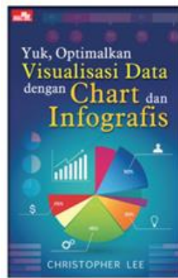
Gambar 2. E- Book Yuk, Optimalkan Visualisasi Data Dengan Chart & Infografis