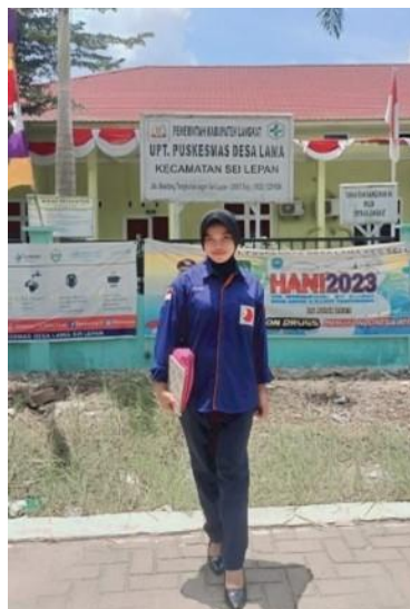
Gambar 3. Foto di lokasi UPT. Puskesmas Sei Lapan