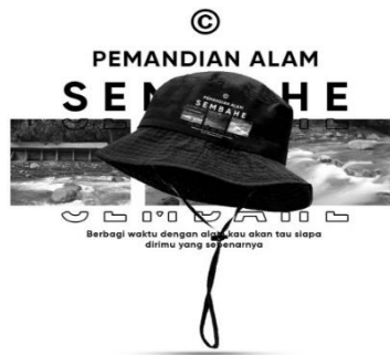
Gambar 11. Topi Rimba