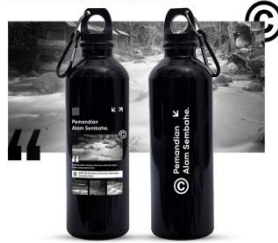
Gambar 10. Tumbler Botol