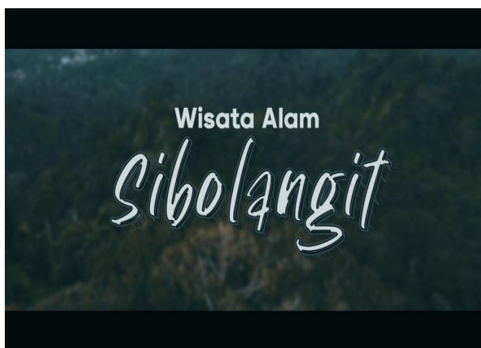
Gambar 15. Backdrop