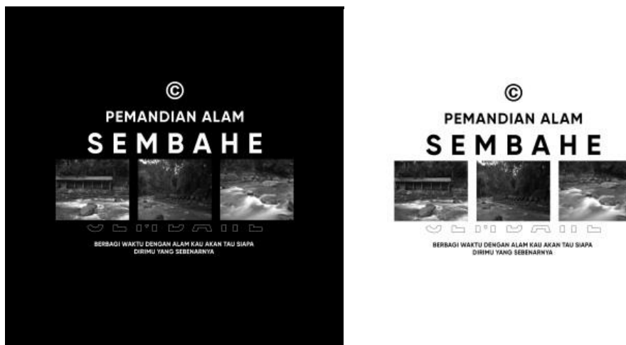
Gambar 12. Topi Rimba