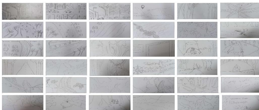
Gambar 7. Sketsa Storyboard Sumber : Muhammad Nur Irsyad, 2023)