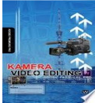
Gambar 4. Book Kamera & Video Editing Adobe premiere Pro

Dari buku ini penulis dapat mengetahui tentang bagaimana mengedit video seperti menghapus scene yang tidak diinginkan, memberikan efek transisi antara satu clip dengan clip lainnya, membuat efek-efek khusus pada video, menambah cahaya, mengatur saturasi, dan mengekspor video hasil editan tersebut seta mempercantik video agar video pun lebih menarik untuk di tonton. Jadi, buku ini penulis gunakan sebagai untuk program cara editing video seperti di adobe premiere pro ini.