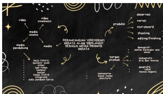
Gambar 6. Metode Berfikir (brainstorming)