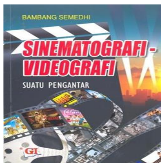
Gambar 3. E - Book Sinematografi – Videografi Suatu Pengantar