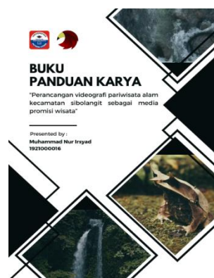
Gambar 17. Buku Panduan Karya Sumber : Muhammad Nur Irsyad, (2023)