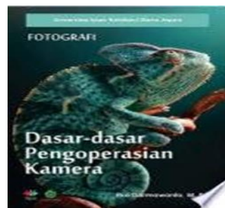
Gambar 2. E - Book Dasar – dasar Pengoperasian Kamera

Buku yang berjudul “Dasar - dasar Pengoperasian Kamera” oleh Eko Darmawanto, M.Pd. ini penulis gunakan sebagai pemahaman tentang bagaimana cara mengoperasikan kamera DSLR sebagai alat dalam pembuatan Videografi Perancangan Media Promosi Wisata Alam di Kecamatan Sibolangit.