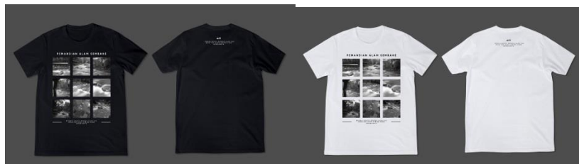
Gambar 9. Tshirt