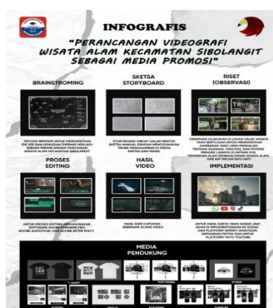
Gambar 16. Infografis