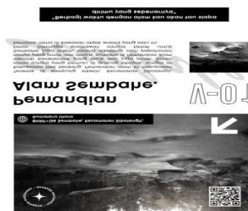
Gambar 13. Topi Rimba