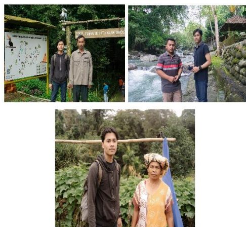
Gambar 5. Foto Wawancara Pengelola Objek Wisata