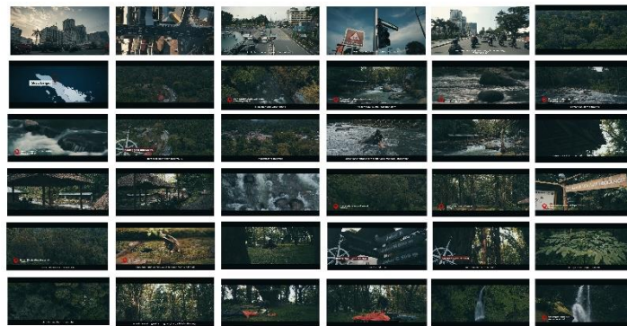
Gambar 8. Media Utama

Berikut adalah ringkasan scene yang terdapat pada Videografi Wisata Alam Di Kecamatan Sibolangit dan setiap scene disesuaikan dengan Storyboard yang sudah di rancang oleh penulis.