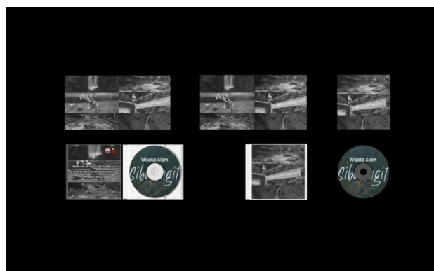
Gambar 14. DVD-R